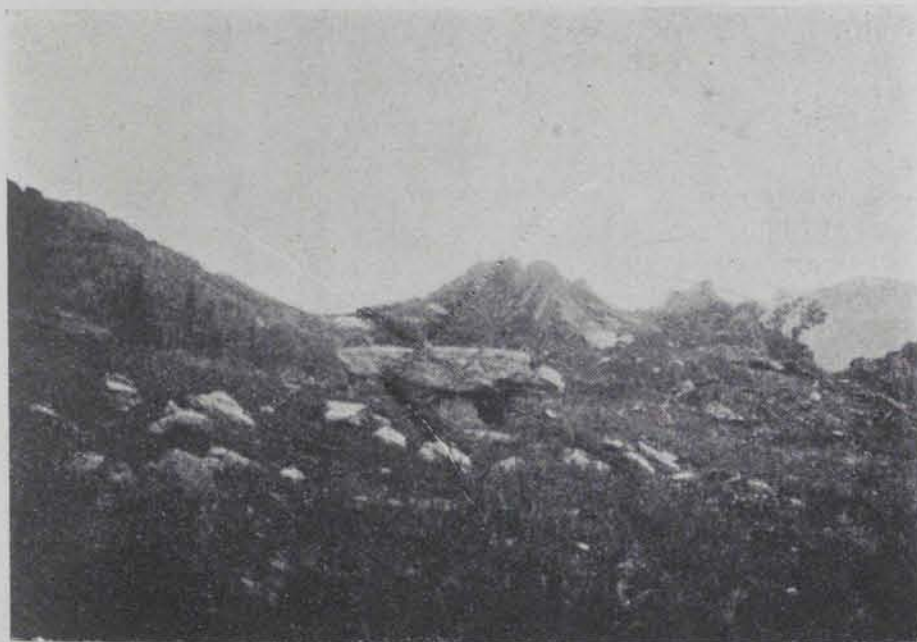
Fig. 73. — Rabós. Sepulcre de la Devesa d'En Torrent